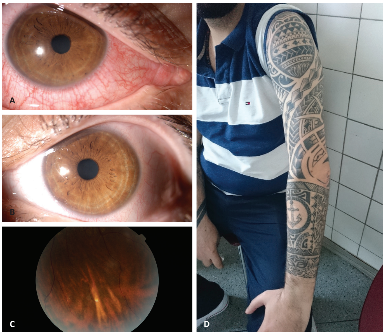
Obr. 2 Pacient č. 2

2a Smíšená injekce spojivky u přední uveitidy na OP