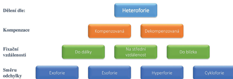
Obr. 1 Klasifikace heteroforií dle způsobu kompenzace, fixační vzdálenosti a směru odchylky (Evans, 2007)

Při posouzení akomodačních funkcí je rutinně ověřována zraková ostrost do blízka a dostupná amplituda akomodace (AA). Adekvátní hodnota AA však neeliminuje možnost poruchy akomodace [23]. V takovém případě může existovat problém s únavou akomodace (Ill-sustained akomodace), se snadností akomodace (infacilita akomodace) anebo neschopností relaxace akomodace. V případě potíží charakteristických pro akomodační poruchy je třeba komplexnější hodnocení akomodačního systému dalšími testy.