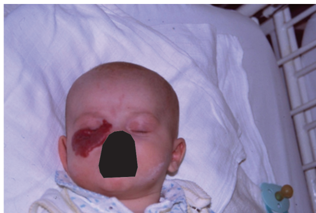
Obr. 4 Kapilární hemangiom dolního víčka u tříměsíčního kojence