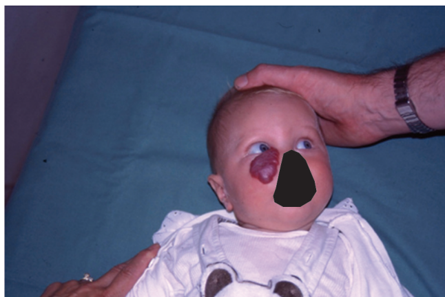
Obr. 3 Kapilární hemangiom dolního víčka u šestiměsíčního kojence

Nežádoucí účinky u našich pacientů jsou vcelku mírné. U pacientů s kortikoidní terapií jsme zaznamenali u jednoho pacienta lokální atrofii měkkých tkání a Cushingoidní projevy u pacienta, kde byl nasazen systémový kortikoid.