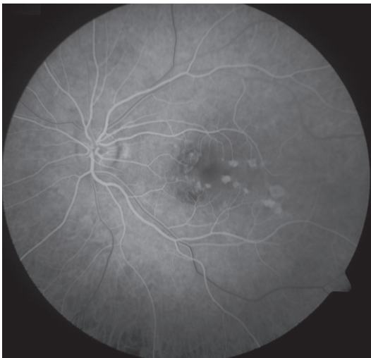
Obr. 3 FAG oka levého. Hyperfluorescence window defektů RPE v místě již neaktivních pozánětlivých lézí