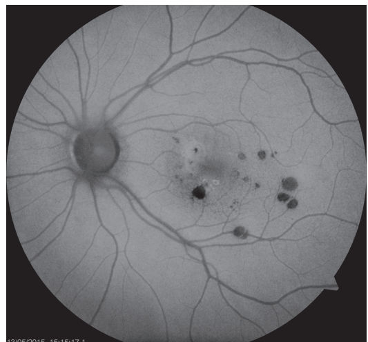
Obr. 6 Auto-fluorescenční fotografie očního pozadí oka levého. Ložiska atrofie RPE