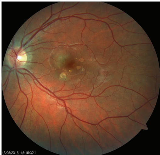
Obr. 1 Levé oko. Nález akutního zánětlivého ložiska v centrální krajině sítnice