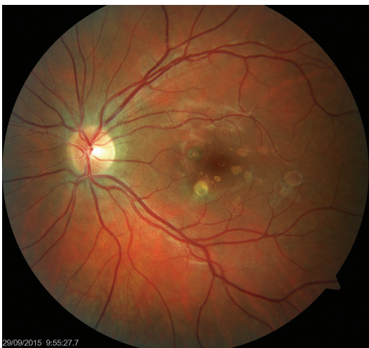
Obr. 5 Levé oko. Původní aktivní ložisko na sítnici se postupně ohraničuje a částečně pigmentuje