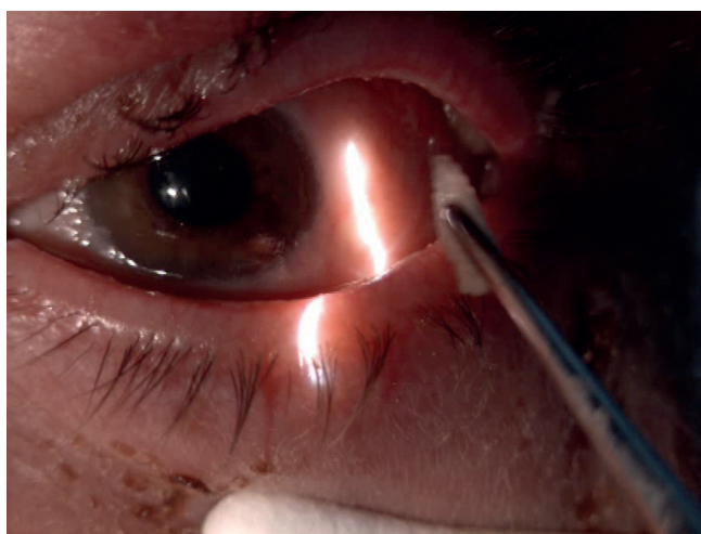
Obr. 3 Manuální vybavení larev v lokální anestezii