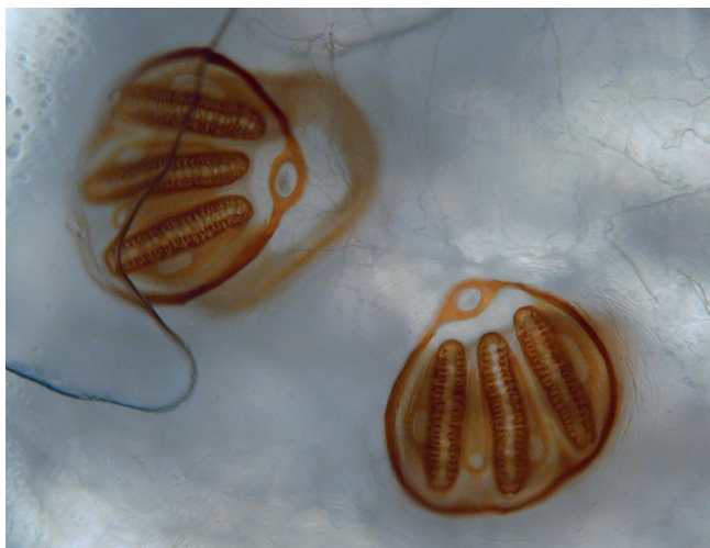
Obr. 5 Mikroskopický pohled na původce externí oční myiázy – larvu z čeledi Calliphoridae

ku pozdních komplikací byl nemocný ošetřen opět v našem zdravotnickém zařízení. V našem ani jiném zdravotnickém zařízení v regionu však ošetřen nebyl.