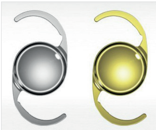
Obr. 1 Čočka CT LUCIA 601P(Y)