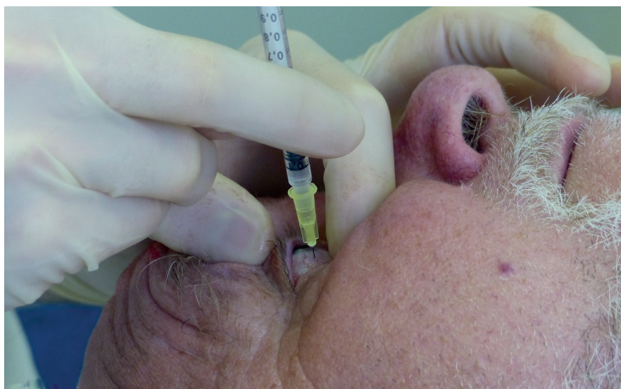
Obr. 1 Technika intravitreální aplikace

V prvním období (roky 2005–2011) – při ATB profylaxi dle SPC jsme aplikovali celkem 2651 injekcí (1087 x Macugen, 1092 x Lucentis, 101 x TMC, 371 x Avastin) (tab. 1). V tomto období byly evidovány dva případy endoftalmitidy (oba po