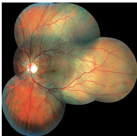
Obr. 1 Kvadrantová amoce zasahující centrální krajinu.

Indicie k provedení operace amoce zevním postupem byly téměř ve všech případech obdobné: mladý pacient s čirou vlastní čočkou, nález lokální nefixované amoce, jasně patrná primární patologie, krát-