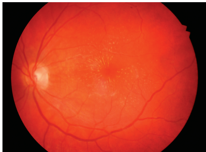
Obr. 2. Vstupní nález hvězdicové makulopatie levého oka