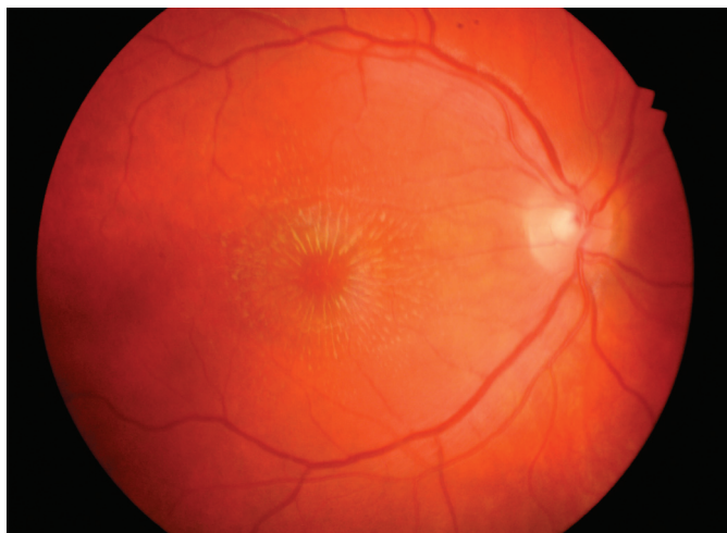
Obr. 1. Vstupní nález hvězdicové makulopatie pravého oka