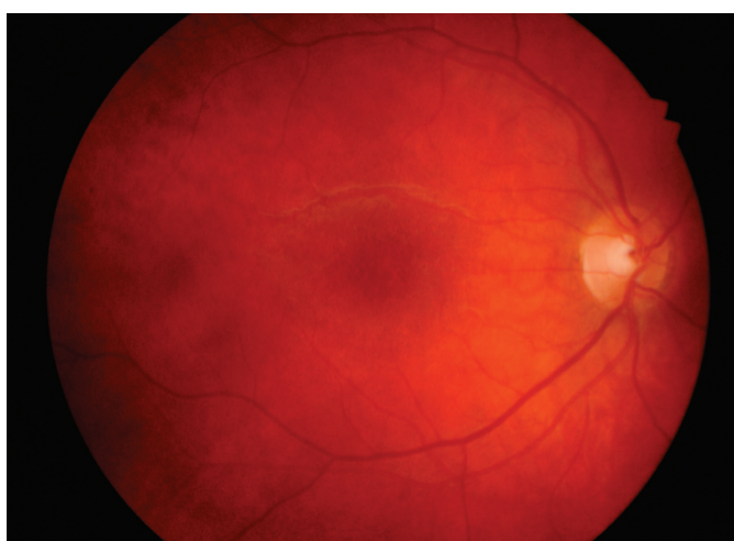
Obr. 5. Téměř úplná resorpce hvězdicové makulopatie pravého oka 2 měsíce po léčbě