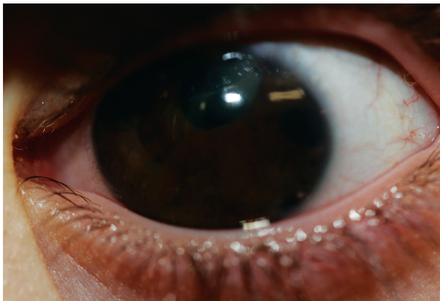
Obr. 2. Obráz ľavého oka s totálnou iridektomiou pri ľ. 1 po operácii