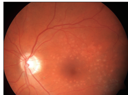
Obr. 4. Stav 1/2 roku po provedené fotokoagulaci – týž pacient jako na obr. 1

Studie prokázala lepší efekt ošetření DME laserem nežli intravitreální aplikací triamcinolonu při jeho menších vedlejších účincích. V extenzi studie DRCR.net bylo cílem porovnat účinnost fotokoagulace sítnice proti kombinované léčbě laserem s intravitreální aplikací triamcinolonu. V druhých dvou ramenech byla porovnáвана účinnost intravitreální aplikace ranibizumabu (Lucentis, Genentech Inc., Novartis Pharma AG) v kombinaci s časnou a odloženou fotokoagulací sítnice laserem.