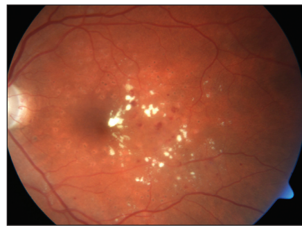
Obr. 1. KSME – při zahájení mřížkové foto-koagulace

V časně arteriální fázi je možno velmi přesně identifikovat FAZ, jejíž rozšíření a nepravidelný tvar je signifikantní pro počáteční diabetickou makulopatii. Současně jsou patrné ektaticky změněné napřímené kapiláry, které mnohdy naznačují oblasti budoucí ischemie. Později může být patrné zbarvení – staining kapilár, který signalizuje poruchu hemato-okulární bariéry, která následně přechází do edému. Difúzní, zvolna narůstající hyperfluorescence makulárního edému, mívá v pozdních fázích