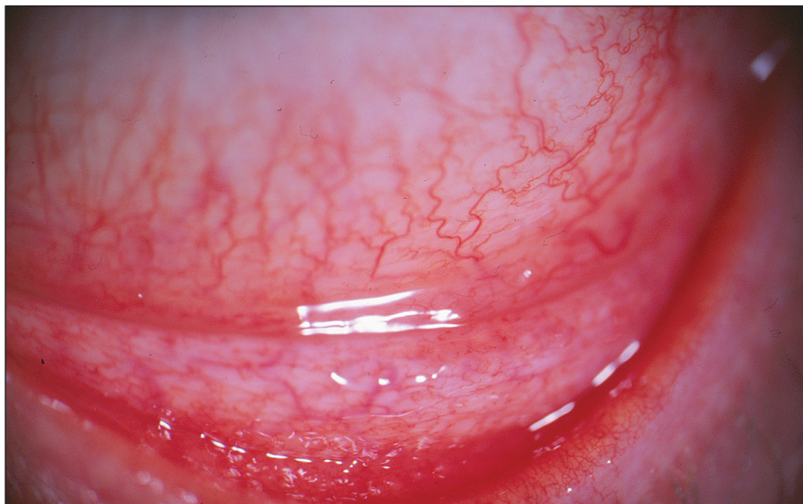
Obr. 3. Pacient č. 5: střední klinický nález – výrazné zduření dolního fornixu s folikuly dolního tarzu doprovázené vinutostí cév bulbární spojivky a hyperémií

O možnosti konjunktivitid etiologie Chlamydia pneumoniae se zmiňuje práce publikovaná před dvaceti pěti lety, ve které autoři referují o folikulární konjunktivitidě bez známek keratitidy [12], ke které patří obraz minimální mukopurulentní sekrece [7]. Chlamydia pneumoniae může dlouhodobě přetrvávat v organismu v makrofázích, které mohou být vektorem jejich šíření v organismu [45]. S variabilními výsledky byla DNA Chlamydia pneumoniae prokázána v periferních leukocytech u pacientů s ICHS [4] a v aterosklerotických plátech [5], kdy se předpokládá společné působení infekčního agens a žírných buněk v produkci cytokinů a matrix degradující metaloproteináz [8]. Pozitivní nález DNA Chlamydia pneumoniae v periferních leukocytech jsme zaznamenali rovněž u dvou našich pacientů s akutní formou folikulární konjunktivitidy a u jednoho nemocného s významně pozitivním sérologickým nálezem svědčícím pro dlouho trvající infekci v možném spojení s Chlamydia trachomatis .