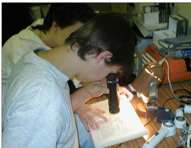
Obr. 3. Teleskop s príložnou lupou