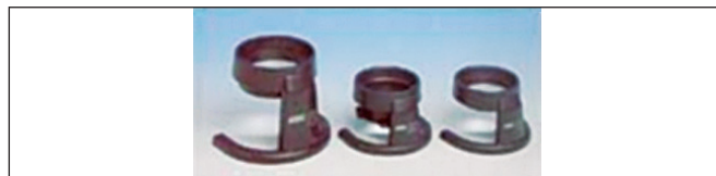
Obr. 10. Lupa stojanková – príložná, bez osvetlenia

Celkovo bolo predpísaných 171 optických pomôcok u 74 pacientov: 76 lúp – 44,4 %, 21 hyperokulárov alebo hyperokrekcii – 12,3 %, 65 teleskopov – 38 % a 9 príložných lúp k te-