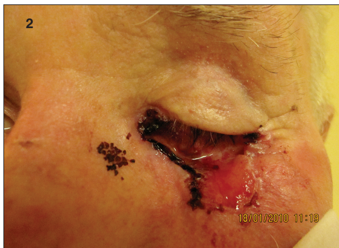
Obr. 2. Bazalióm T3