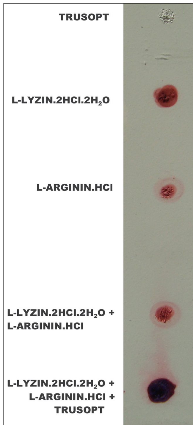
Obr. 1. Výsledok vyšetrenia ninhydrínovým činidlom na prítomnosť voľných aminokyselín a peptidův na tenko vrstevnej chromatografii (vysvetlenie v texte).

toky, uvedené v kapitole Materiál a metodika, sme naniesli v množstvách 60 \mu\text{l} na tenkovrstevnú sklenenú chromatografickú platňu (Merck) a po ich vysušení teplým vzduchom sme zafarbili organickým činidlom ninhydrínom, selekčným pre voľné aminokyseliny a peptidy. Aminokyseliny lyzín a arginín ako aj ich zmesi sa farbili typicky červeno; antiglaukomatikum Trusopt neprejavil žiadnu ninhydrín pozitívnu reakciu (nefarbil sa). Zmes týchto dvoch aminokyselín s Trusoptom vykazovala odlišné fialovo modré zafarbenie, ktoré je typické pre komponenty peptidického charakteru (obr. 1).