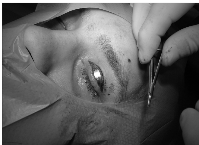
Obr. 8. Závěrečná pozice implantátu na horním víčku