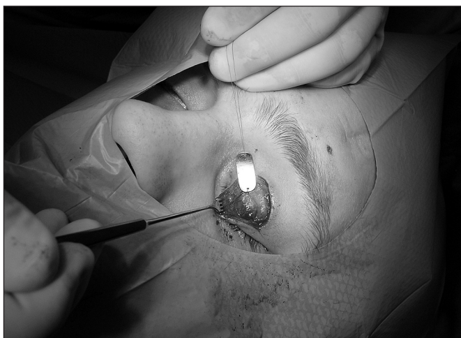
Obr. 5. Fixace implantátu k tarzu