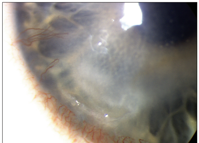
Obr. 2B. Detail epiteliálního defektu s hlubokou vaskularizací

Výsledky sledování pacientů se systémovou léčbou acyclovirem byly následující: celkem bylo léčeno systémovým acyclovirem 10 pacientů, u 4 pacientů jsme zaznamenali po-