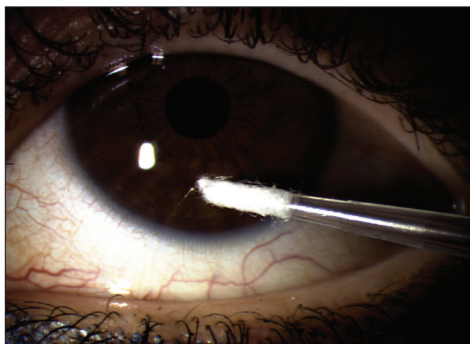
Obr. 1. Odběr PCR jednorázovou mikropipetou s otiskem v místě keratitidy