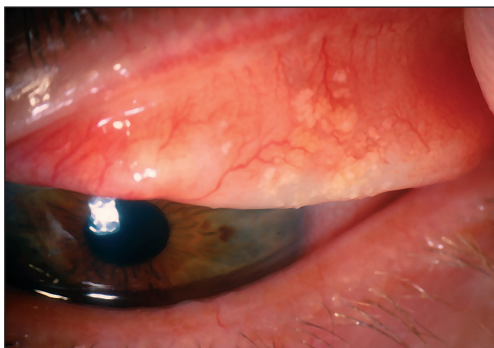
Obr. 2. Splývající (konfluentní) konkrémenty ve spojivce horního tarzu

Spojivkové konkrémenty představují spolu s pinguekulou jednu z nejčastějších forem degenerace spojivky (obr. 1).