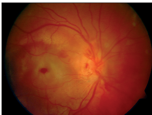
Obr. 2. Barevné foto submakulární hemoragie po traumatu před operací

Průběh onemocnění při submakulární hemoragii, zvláště takové, která je spojena s věkem podmíněnou makulární degenerací nebo s traumatem oka je velmi závažný stav [1, 2]. Glatt [6] popisoval ireverzibilní poškození sítnice králíků 24 hodin po vzniku subretinální hemoragie. Na druhé straně sítnice kočky se zdá být podstatně odolnější, subretinální hemoragie způsobila těžkou degeneraci vnitřní a zevní vrstvy sítnice během 7 až 14 dnů [12]. Fibrin se zdá být hlavním faktorem v přímém a časném poškození sítnice. Avšak první publikace o mechanickém odstranění subretinálního koagula u lidí vykazovaly velmi špatné výsledky zrakové ostrosti [3, 14, 15].