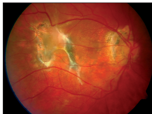
Obr. 3. Barevné foto fundu po operaci

Průběh onemocnění při submakulární hemoragii, zvláště takové, která je spojena s věkem podmíněnou makulární degenerací nebo s traumatem oka je velmi závažný stav [1, 2]. Glatt [6] popisoval ireverzibilní poškození sítnice králíků 24 hodin po vzniku subretinální hemoragie. Na druhé straně sítnice kočky se zdá být podstatně odolnější, subretinální hemoragie způsobila těžkou degeneraci vnitřní a zevní vrstvy sítnice během 7 až 14 dnů [12]. Fibrin se zdá být hlavním faktorem v přímém a časném poškození sítnice. Avšak první publikace o mechanickém odstranění subretinálního koagula u lidí vykazovaly velmi špatné výsledky zrakové ostrosti [3, 14, 15].