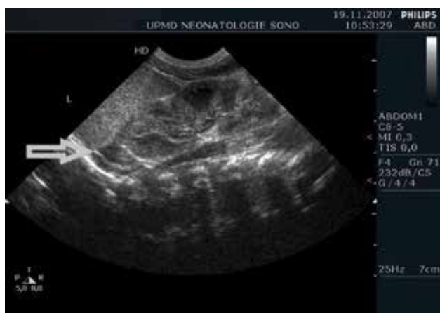
Obr. 2. Sonografické zobrazení levé ledviny a nadledviny (šipka) u nezralého novorozence (26. týden), nález je bez patologie

24]. Důsledkem nemožnosti interpretace výsledků laboratorní diagnostiky je velmi různorodá klinická praxe. Na některých pracovištích je léčba indikována podle sérových, případně stimulovaných hladin kortizolu, zatímco na jiných se laboratorní diagnostika nepoužívá [23]. Opakovaně uváděnou diagnostickou možností by mohlo být, na základě dat ze zvířecího modelu RAI (pavián), měření volného kortizolu v moči [19, 25]. Sonografické zobrazení nadledvin je obvykle bez patologického nálezu (obr. 2) a v diagnostice RAI se nepoužívá.