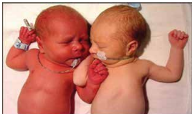
Obr. 2. Pletorický vzhled novorozence (vlevo) při polycytemii – komplikace protražované placentární transfuze

Univerzálně popisovanou výhodou PT je zvýšení zásob železa (prvních 3–6 měsíců života), koncentrace