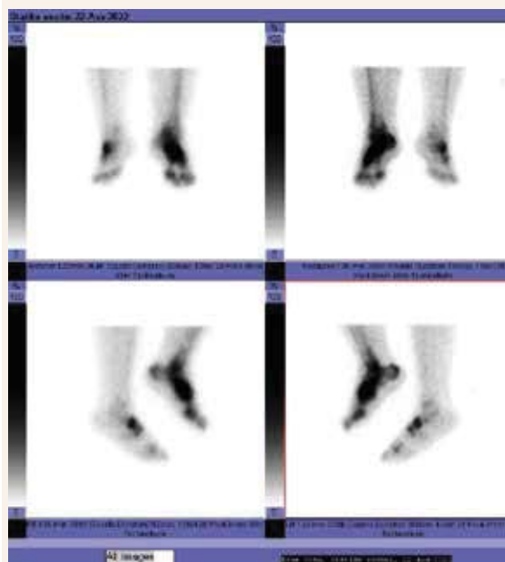
Obr. 1 | Suspektní Charcotova osteoartropatie levé nohy

12. 2022 bylo doplněno MRI levé nohy se závěrem: osteolytická destrukce os cuneiforme intermedium s artriticko-artrotickými změnami ve skloubení os naviculare/ ossa cuneiformia – s uzurací kloubních ploch, masivním edémem kostí, zmnoženou nitrokloubní tekutinou a skle-