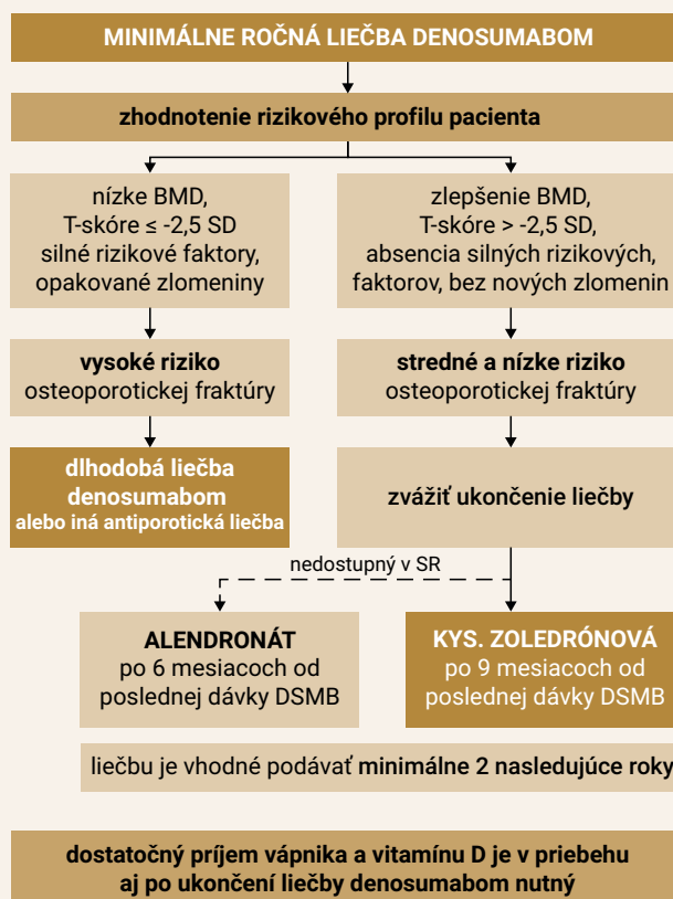
Schéma | Algoritmus liečby denosumabom

Prínos liečby je aj u pacientiek s osteoporózou a vysokým rizikom karcinómu prsníka. Liečba nie je vhodná u pacientiek s klimakterickým syndrómom a s rizikom tromboembolizmu. Dávkovanie, spôsob podania a kon-