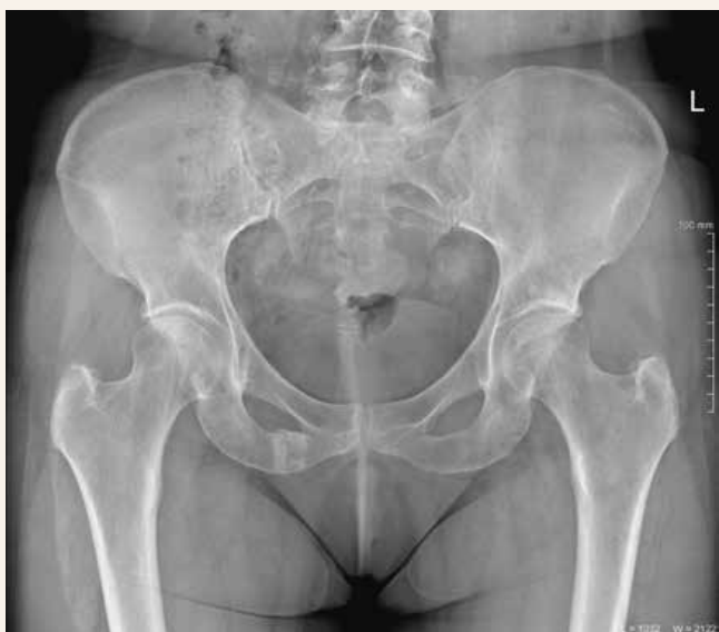
Obr. 3 | RTG-sníмка panvy 4 mesiace po začiatku ťažkostí s evidentnou pretrvávajúcou lomnou líniou v oblasti dolného ramienka lonovej kosti vpravo so sklerotickými okrajmi a kraniálnym zahrotením