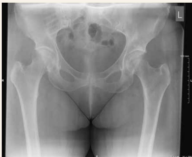
Obr. 1 | Prvotná RTG-snímka bedrových kĺbov bez evidentného patologického nálezu

Stav bol uzavretý ako entezopatické bolesti v oblasti praveho bedrového kĺbu, no vzhľadom k neutíchajúcim bolestiam pri záťaži pravej dolnej končatiny a nutnosti odľahčovania za pomoci 2 nemeckých bariel, bolo 20. 1. 2022 vykonané MR vyšetrenie bedrových kĺbov s nálezom insuficientnej fraktúry horného aj dolného ramienka lonovej kosti vpravo v štádiu hojenia s pretrvávajúcim edémom kostnej drene a okolitých mäkkých štruktúr (obr. 2).