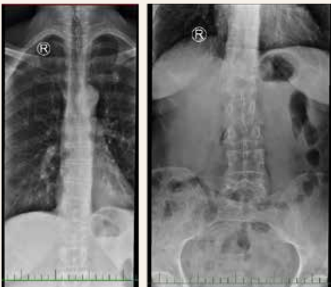
Obr. 2 | RTG hrudní a bederní páteře, předozadní snímek. Komprese Th8 s lehkým prolomením horní krycí plochy, komprese L1.