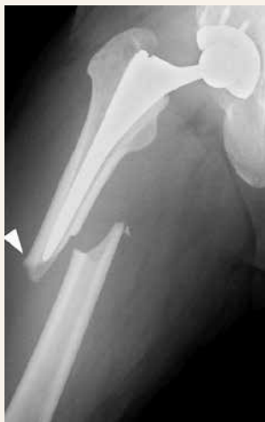
Obr. 5 | Periprotetická zlomenina s radiologickým obrazem atypické fraktury femuru. Upraveno podle [6]