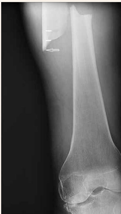
Obr. 4 | Atypická fraktura diafýzy pravého femuru u stejné pacientky jako na obr. 3 o 2 roky později

Dvojitá lomná linie odpovídá spirálnímu typu zlomeniny (malé šipky). Jelikož je zlomenina nízkotraumatická, netříštivá, mediálně s hrotem (velká šipka) a se ztluštěním laterálního kortexu v místě zlomeniny, v němž je průběh lomné linie horizontální, jde o atypickou zlomeninu femuru.