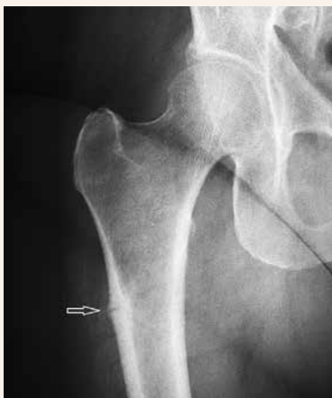
Obr. 1 | Inkompletní atypická subtrochanterická fraktura femuru vpravo postihující laterální kortex

často bývá jejich výskyt současně oboustranný. Přestože na rentgenovém snímku má atypická zlomenina obraz únavové zlomeniny, pro špatnou kvalitu poškozené kosti ji radiologové označují jako „insufficiency fracture“ [1]. Článek se podrobněji zabývá radiologickým obrazem atypické fraktury femuru včetně obrazové dokumentace, upozorňuje na existenci spirálních atypických zlomenin, periprotetických zlomenin s RTG-charakteristikami atypických zlomenin femuru a pseudofrakturn podobných atypickým zlomeninám u geneticky podmíněných kostních chorob. Budou uvedeny dosud známé rizikové faktory atypických zlomenin a doporučení pro terapii.