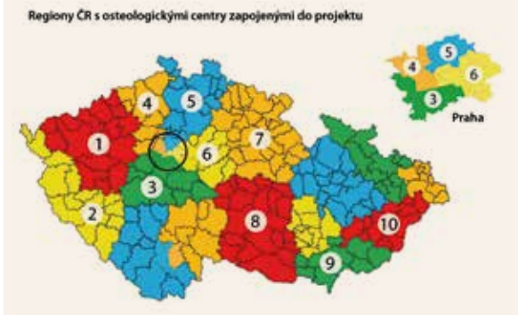
Obr. | Regiony ČR s osteologickými centry spolupracujícími na projektu