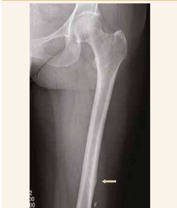
Obr. 2 | CT-scan levé stehenní kosti (11. 1. 2019, vstupní): horizontálně probíhající vlasová linie v laterální části kortikalis ve střední třetině diafýzy levého femoru