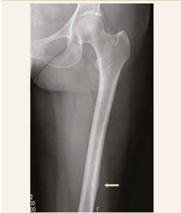
Obr. 2 | CT-scan levé stehenní kosti (11. 1. 2019, vstupní): horizontálně probíhající vlasová linie v laterální části kortikalis ve střední třetině diafýzy levého femoru