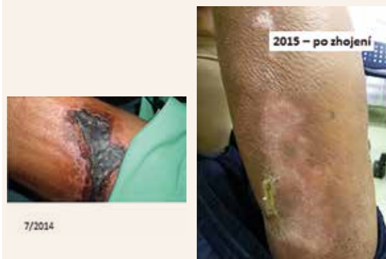
Obr. 2 | Kalcifylaxe – vstupní nález a zhojení. Kazuistika 2.

Koncentrace vápníku i fosforu v krvi nejsou rozhodující: až 80 % pacientů má normo- či hypokalcemii (tj. nikoliv hyperkalcemii), až 40 % má normo- či hypofosfatemii