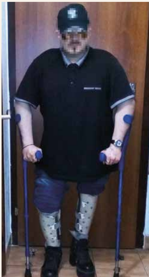
Obr. | Pacient (brat)