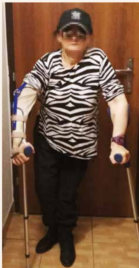
Obr. | Pacient (sestra)

U 43-ročnej pacientky, sestry 38-ročného pacienta, je priebeh ochorenia odlišný. Do 30 rokov u nej prevládajú najmä opakované luxácie ramenných kĺbov. Po 30. roku