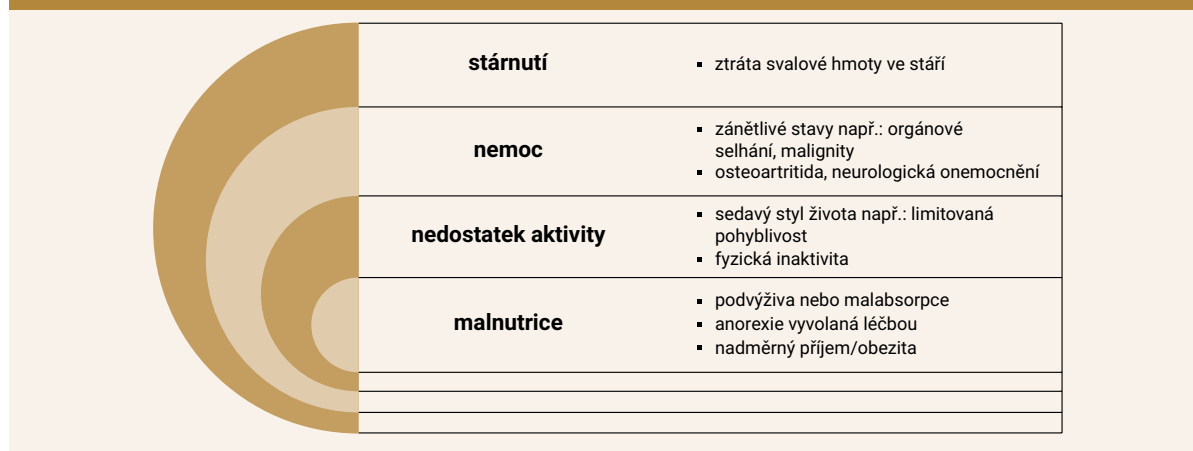
Schéma 1 | Znázornění příčin sarkopenie. Upraveno podle [2]

ASM – Appendicular Skeletal Muscle Mas SPPB – Short Physical Performance Battery TUG – Timed-Up and Go test