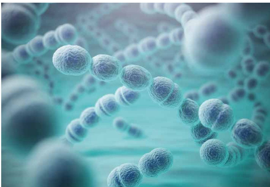
Obr. 2. 3D ilustrace ukazující bakterie Streptococcus pneumoniae .

epiteliální dysfunkce, zvýšení metabolických nároků, snížení saturace kyslíku a hypotenze se sekundární vazokonstrikcí. Aktivace sympatiky také zvyšuje riziko vzniku fibrilace síní [5]. Mezi nejčastější komplikace chřipky řadíme primární virovou pneumonii a bakteriální tracheobronchitidu či pneumonii. Všechny tyto komplikace jsou spojeny se závažným průběhem a vysokou letalitou.