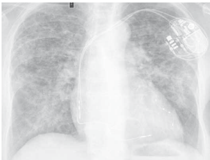
Obr. 1. Skiagram hrudníku 4/2018 – před léčbou – difuzní splyvavé stíny bilaterálně, rozšíření srdečního stínu.