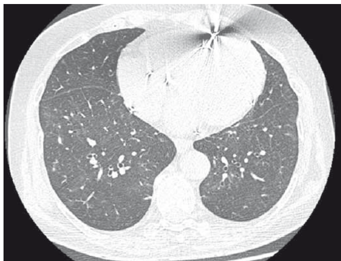
Obr. 4. HRCT plic – stejně jako na skiagramu hrudníku je patrné téměř úplné vymizení intersticiálního postižení bilaterálně.

tak bývá ve většině případů nejvíce postižen pravý horní lalok. Příčina tohoto jevu není přesně známá, předpokládá se účast kyslíkových radikálů, přičemž právě tato oblast plic je teoreticky nejlépe ventilována [7]. Funkční vyšetření odhalí snížení difuzní plicní kapacity – za signifikantní se považuje pokles o 15–20 % oproti výchozím hodnotám, může dojít i k rozvoji restriktivní ventilační poruchy [8]. Zvýšení denzity jaterního parenchymu na nativním CT jako známka hepatální toxicity [9], oční postižení a postižení štítné žlázy [10] může napomoci uzavřít diagnózu a je po něm potřeba vždy aktivně pátrat. V nejasných případech je vždy indikováno doplnění bronchoskopie – zejména k vyloučení jiných možných