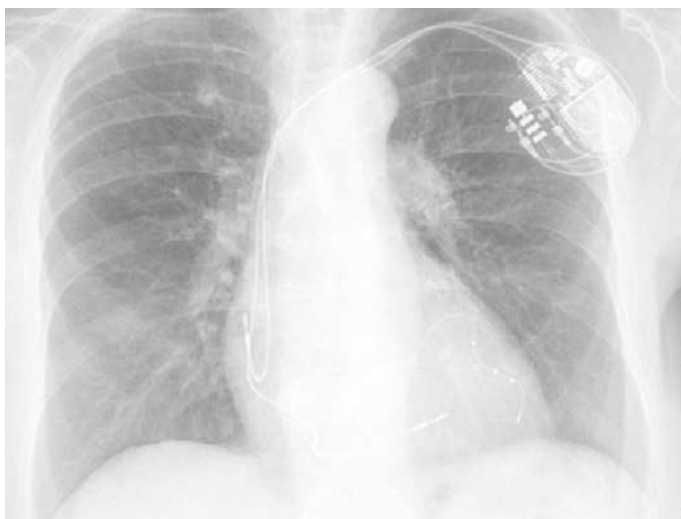
Obr. 3. Skiagram hrudníku – prakticky kompletní restituce nálezů – patrný jen nevýrazné pozánětlivé změny bilaterálně bazálně.