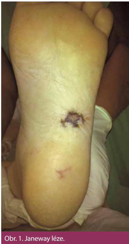
Obr. 1. Janeway léze.

Prvotními důvody kontaktu pacienta se zdravotní péčí jsou nespecifické příznaky, především horečka, dále pak ischemické projevy systémové embolizace (mozková příhoda, infarkt sleziny, ledviny, akutní mezenterální ischemie apod.) a infekční projevy systémové embolizace (periferní abscesy). U těchto projevů budí podezření na IE především jejich kombinace (horečka ve spojení s novým srdečním šelestem či periferními embolizacemi) nebo netypický charakter (nevysvětlitelné abscesy a jejich neobvyklá lokalizace). Bohužel, většinou až později v průběhu onemocnění bývají zachyceny specifičtější, ale poměrně vzácné příznaky. Spíše u akutních forem IE bývají přítomny Janewayovy léze (nebolestivé nepravidelné tmavé hemoragické makuly, nejčastěji lokalizované na dlaních, ploskách nohou či plantární ploše prstů, trvající dny až týdny). Ke kožním projevům při protražovaném průběhu IE patří i Oslerovy uzlíky (bolestivé růžové noduly, často s bledým centrem, vyskytující se na prstech rukou či prstcích nohou, výsev je prchavý, trvá hodiny až dny, častěji u „subakutně“ probíhajících endokarditid). Výskyt těchto projevů se odhaduje na asi 2–5 % případů, zatímco v předantibiotické éře se vyskytovaly ve 40–90 % [9]. Délétrvajícím endokarditida vede k tvorbě imunokomplexů s následnou imu-