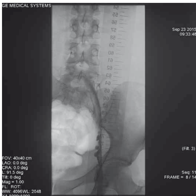
Obr. 2. Angiografie ileofemorální trombózy během lokální trombolitické terapie (LKT) – parciální lýza vysoké trombózy levé dolní končetiny (v levostranných hlubokých žilách zaveden katetr systému EKOS – ultrazvukem enhancovaná LKT).