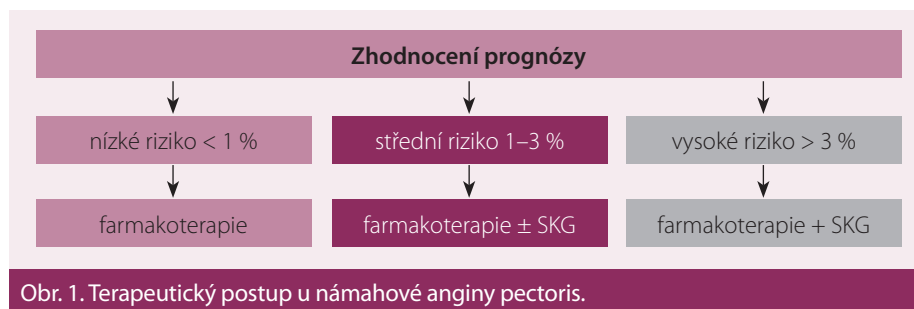
Obr. 1. Terapeutický postup u námahové anginy pectoris.