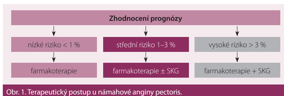
Obr. 1. Terapeutický postup u námahové anginy pectoris.