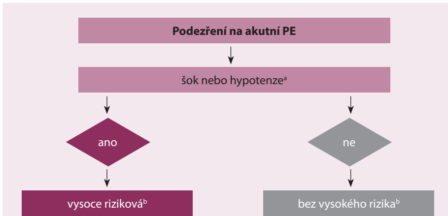
Obr. 1. Bazální riziková stratifikace akutní PE.

PE – plicní embolie, a definováno jako systolický krevní tlak < 90 mm Hg, nebo pokles systolického tlaku krve o ≥ 40 mm Hg, po dobu > 15 min, pokud toto není zapříčiněno čerstvě vzniklou arytmií, hypovolemií, nebo sepsí, b na základě odhadu PE vyžadující hospitalizaci, nebo dle 30denní mortality.