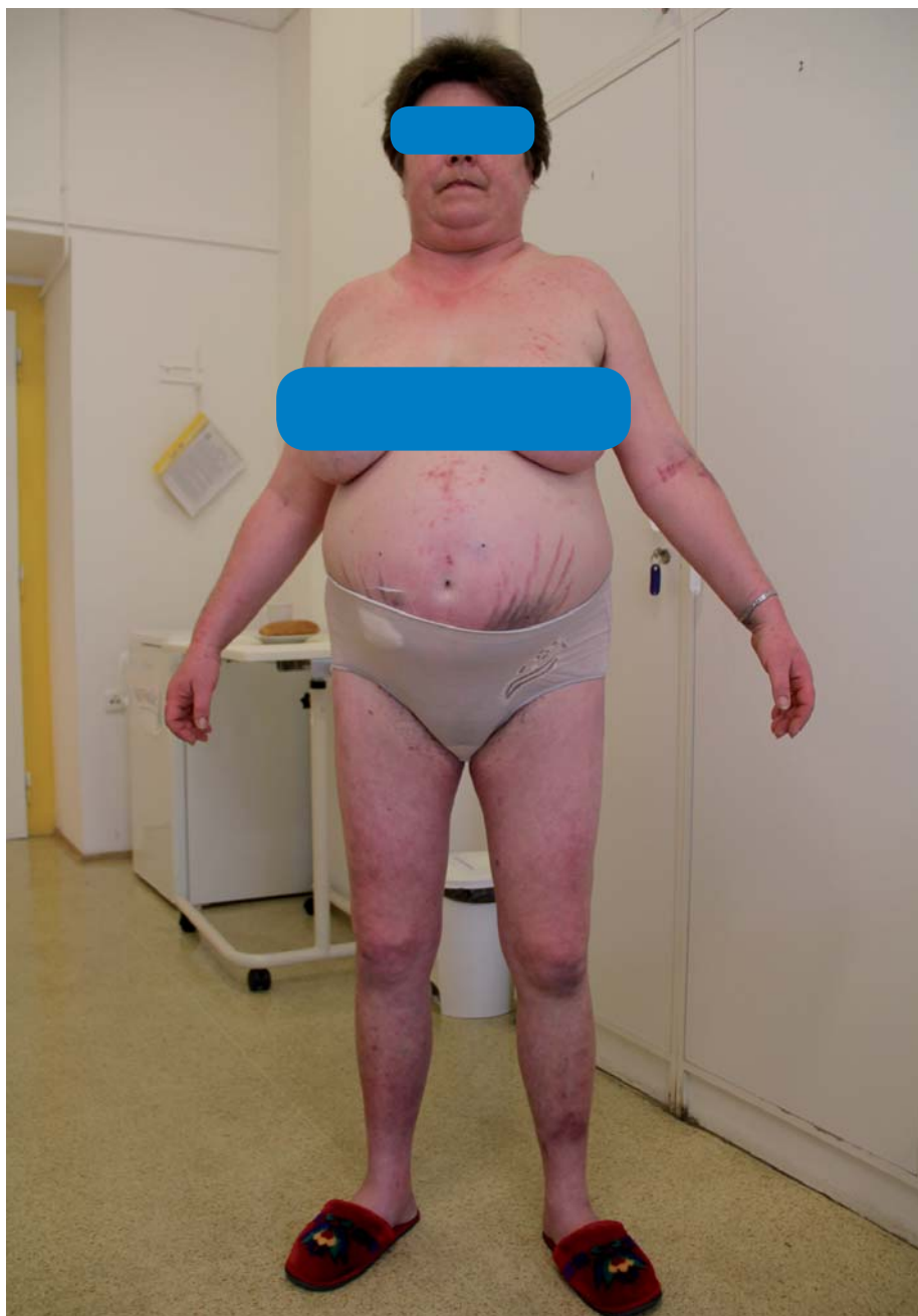
Obr. 1. Vzhled pacientky s Cushingovým syndromem.

Vyskytuje se až u 75 % pacientů s CS a CS patří mezi základní typy sekundární hypertenze s často typickými znaky, jako je rychlý rozvoj, tíže hypertenze, rezistence na léčbu, vymizení cirkadiálního rytmu TK, u vysoce aktivních případů rovněž hypokalemie. Patogeneticky se na rozvoji arteriální hypertenze u CS podílí řada faktorů [13]. Nadbytek volného kortizolu