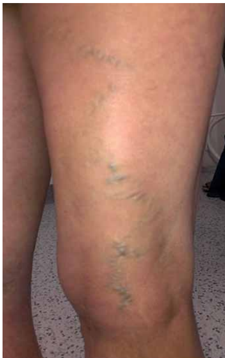
Obr. 3. Varixy zadní strany stehna v oblasti insuficientní v. Giacomini.

lesti u 54 % žen a k významnému zlepšení u dalších 23 % [8].