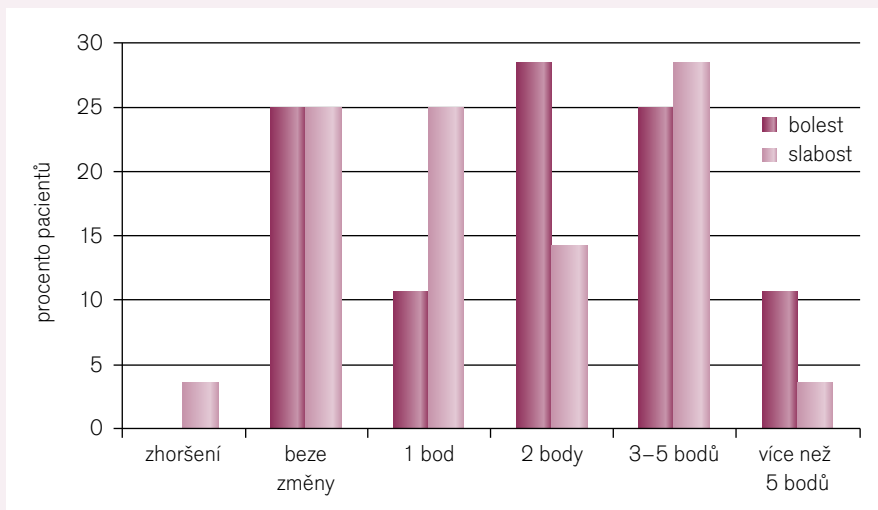
Graf 2. Změny subjektivních pocitů mezi prvním a posledním vyšetřením.

Young et al [12] publikovali dvojité slepou, placebem kontrolovanou studii, v níž k 10–40 mg simvastatinu podávali u 44 pacientů 200 mg KQ10/den. Ačkoli pozorovali zvýšené plazmatické hladiny KQ10, nezaznamenali subjektivní statisticky významné rozdíly mezi placebovou a léčenou větví. KQ10 podávali pouze 12 týdnů, což může být krátká doba k projevení se plného efektu. Oproti tomu Caso et al [13] podávali 32 pacientům s hypercholesterolemií a statinovou myopatií 100 mg KQ10 oproti 400 IU vitamínu E. Ve větvi léčené KQ10 došlo k poklesu bolestivosti svalů o 38 %, kdežto ve větvi léčené vitamínem E nebyl pozorován rozdíl. Konečně Mabuchi et al [14] podávali KQ10 pacientům léčeným 10 mg atorvastatinu s elevací CK,