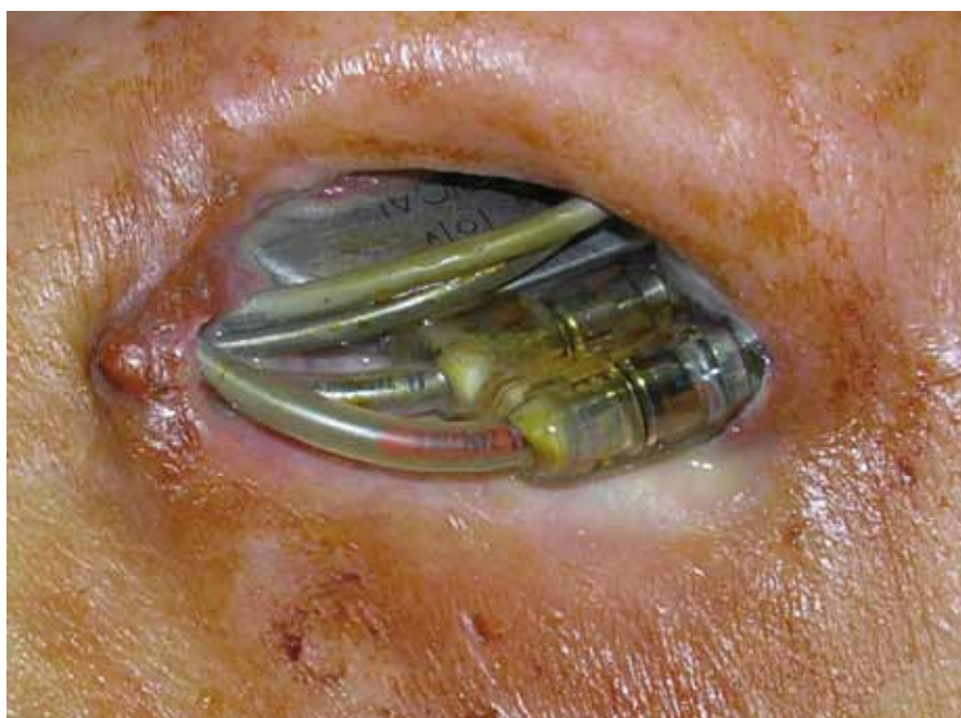
Obr. 2. Dekubitus v kapse kardiostimulátoru s protrusí elektrod a přístroje.

Incidence infekce elektrod aktivních implantátů je v literatuře udávána velmi variabilně od 0,13 % do 19,9 %. Tento rozptyl může být