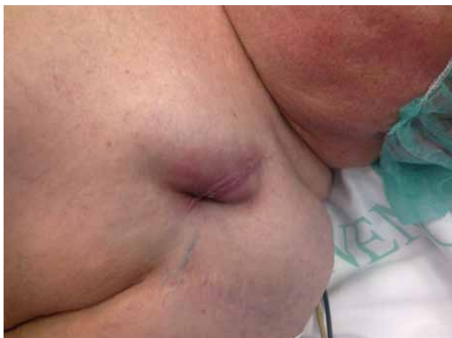
Obr. 3. Lokální zánět v kapse kardiostimulátoru.

Trvalá kardiostimulace patří dnes již k rutinním výkonům a jako každý invazivní výkon má své komplikace, s kterými musíme počítat, naučit se je včas rozpoznávat a řešit. Nejzávažnější komplikace vznikají během prvních tří měsíců od implantace. Při každém podezření na symptomy související se stimulačním systémem je nutné pacienta odeslat na specializované pracoviště, kde byl tento systém pacientovi implantován.