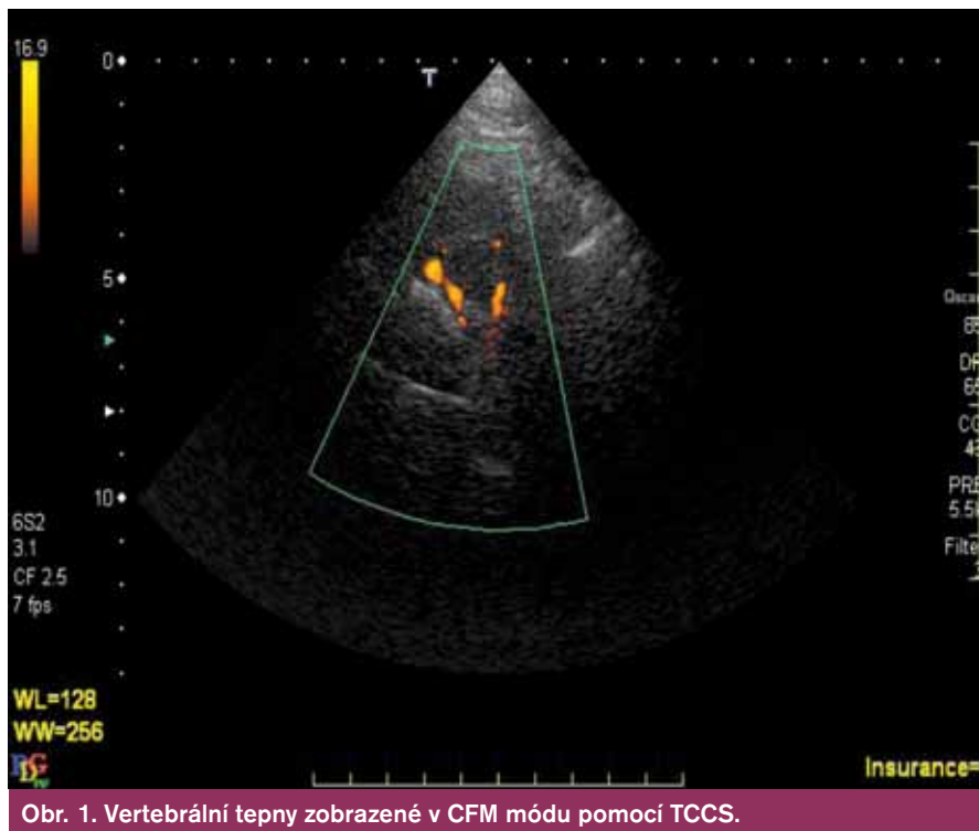
Obr. 1. Vertebrální tepny zobrazené v CFM módu pomocí TCCS.

Farmakologická léčba se opírá o dva základní pilíře, léčbu antitrombotickou a farmakologickou (vedle obvyklých režimových opatření) kontrolu RF aterosklerózy.