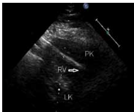
Obr. 1. Transthorakální echokardiografie – modifikovaná parasternální projekce – vzhledem k špatné vyšetřitelnosti a artefaktům z elektrody málo výtěžná (PK – pravá komora, LK – levá komora, RV – defibrilační elektroda).

Problematika perforace pravé srdeční komory defibrilační elektrodou představuje velmi aktuální problém s ohledem na narůstající populaci nositelů implantabilních kardioverterů-defibrilátorů. V literatuře je často zmiňována doba manifestace od zavedení defibrilačního systému, a i když perforace v akutním poim-