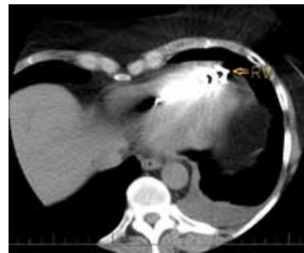
Obr. 2. CT vyšetření hrudníku – hrot defibrilační elektrody pravděpodobně zasahuje mimo srdeční konturu, nelze však jednoznačně odlišit případnou perforaci myokardu od artefaktů způsobených elektrodou (RV – defibrilační elektroda).

Pacientka byla přeložena na kardiochirurgické pracoviště k extrakci defibrilační elektrody za kontroly jícnovou echokardiografií. Výkon proběhl bez komplikací, dle kontrolního echokardiografického vyšetření přetrvával jen drobný perikardiální výpotek – šlo však o stacionární nález. Následně s odstupem dvou týdnů byla pacientce zavedena nová defibrilační elektroda s umístěním do spodního septa pravé komory (Durata 7F 7120Q/65 cm, St. Jude Medical, Inc., Minnesota, USA) a byl připojen původní defibrilátor. Parametry citlivosti a stimulace změ-