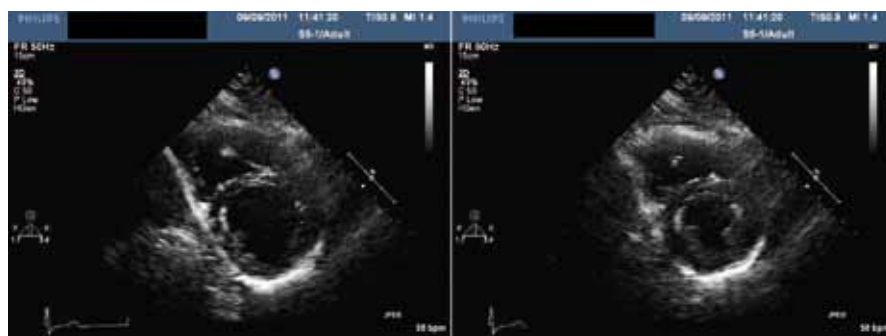
Obr. 3. Kontrolní echokardiografie, levá komora v krátké ose a) v diastole b) v systole.

Obraz KMP může být indukován kteroukoli supraventrikulární i komorovou tachyarytmií (tab. 1) [5], KMP vyvolaná komorovými arytmiemi je však zpravidla těžšího