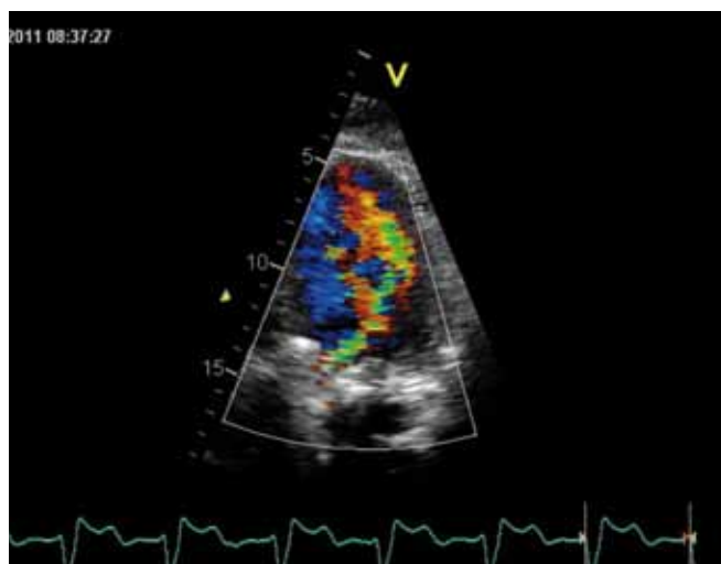
Obr. 2. Transtorakální echokardiografie. Významná aortální regurgitace z apikální čtyřdutinové projekce s aortou – CFM zobrazení.

selhání. Pacient byl zaléčen kontinuálním parenterálním podáním isoketu a i.v. bolusy kličkových diuretik s výrazným ústupem dušnosti a bolestmi na hrudi. Dále byla podána p.o. antibiotická terapie z důvodu rozvoje respiračního infektu. Druhý den hospitalizace byl již pacient kardiopulmonálně kompenzován, při ranní vizitě byl však zjištěn intermitentní diastolický šelest s maximem v Erbově bodě spojený s vymizením arteficiálního zvuku mechanické chlopně. Bylo provedeno opětovné transtorakální echokardiografické vyšetření s nálezem intermitentní hemodynamicky významné aortální regurgitace (obr. 1, 2). Pro podezření na mechanickou dysfunkci aortální protězy bylo doplněno jícnové echokardiografické vyšetření, při kterém byla zjištěna nevýznamná, technická, aortální regurgitace. V oblasti před-