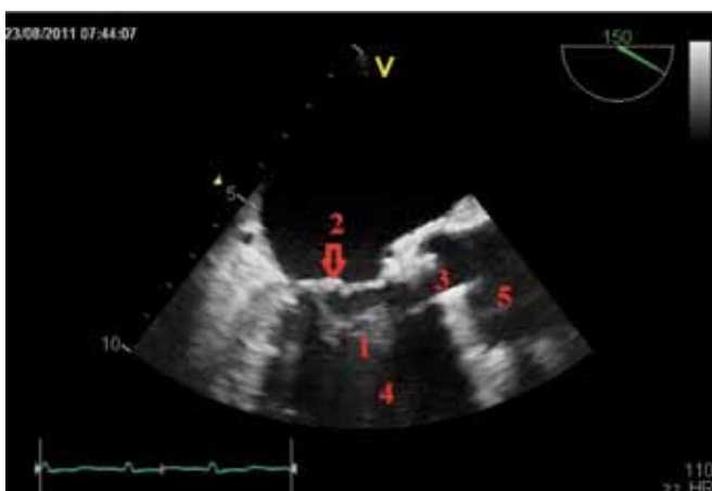
Obr. 3. Transesophageální echokardiografie. Echogenní útvar vycházející z mitrální chlopně vylající do LVOT. 1 – akcesorní závěsný aparát mitrální chlopně, 2 – mitrální chlopně, 3 – otevřená umělá aortální chlopně, 4 – levá komora, 5 – aorta

V případě náhle vzniklé aortální regurgitace manifestující se akutním srdečním selháním u pacienta po mechanické chlopně náhradě je třeba myslet v první řadě na mechanickou dysfunkci chlopně náhrady způsobenou nejčastěji infekční endokarditidou či trombotickou okluzí, zvláště při neúčinné antikoagulační terapii. Jako další příčina přichází v úvahu přerůstající panus či méně často srdeční nádor. Velice vzácnou příčinou může být i akcesorní závěsný aparát mitrální chlopně, jako tomu bylo i v případě našeho pacienta. Toto raritní kongenitální onemocnění se často manifestuje symptomy způsobenými obstrukcí výtokového traktu [1], výjimečně pak těžkou aortální regurgitací [2]. Ve většině případů se symptomy objeví již v první dekádě života