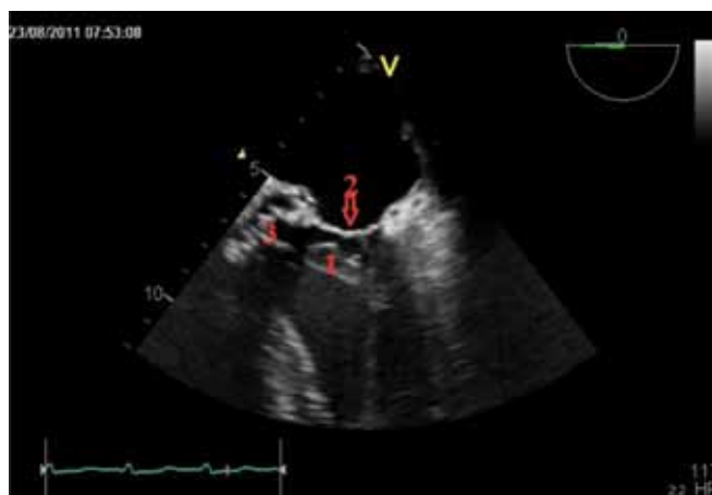
Obr. 4. Transesophageální echokardiografie. Echogenní útvar vycházející z oblasti mitrální chlopně vylající do LVOT. 1 – akcesorní závěsný aparát mitrální chlopně, 2 – mitrální chlopně, 3 – otevřená umělá aortální chlopně