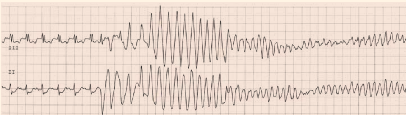
Obr. 1. Záznam z monitorace EKG u pacienta se stenokardií a sinusovou tachykardií. V modifikovaných končetinových svodech jsou patrné deprese úseku ST, časná KES (první ektopický komplex) spustila polymorfni komorovou tachykardii, která přešla rychle do fibrilace komor.

terností. Dochází ke zpomalení vedení vzruchu či dokonce k blokadě šíření vzruchu. Výsledkem jsou tak rozdílné elektrofyziologické vlastnosti sousedících skupin myocytů na různě velkém okrsku myokardu a tato heterogenita může vést k manifestaci arytmogenního mechanismu.