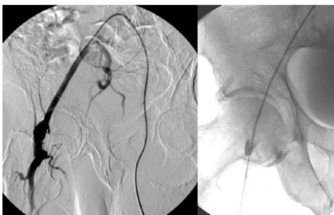
Obr. 2. Zavedení katetru do femoropopliteálního bypassu k lokální trombolýze.