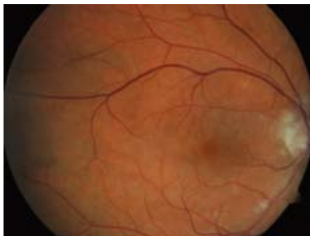
Obr. 1. Oční pozadí – pacient, muž, rok narození 1946. Sukcesivní embolizace, cca 48 hod od vzniku prvních obtíží, vizus 0,5.