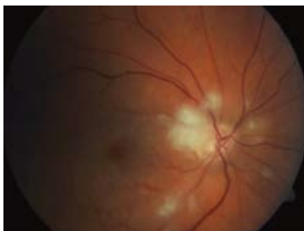
Obr. 3. Oční pozadí – týž pacient. Po 12 hod od podání systémové trombolytické terapie. Pacient počítá prsty před okem.